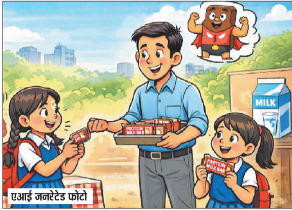
एआई जनेटेटेड फोटो

अब राजकीय वरिष्ठ माध्यमिक स्कूलों की कक्षा 9वीं से 12वीं की छात्राओं को मिड-डे-मील के तहत प्रोटीन मिल्क बार और फोर्टिफाइड फ्लेवर्ड मिल्क दिया जाएगा। इसका उद्देश्य छात्राओं को संपूर्ण पोषण प्रदान करना है और उनकी सेहतमंद बनाता है। इसी कड़ी में विद्यालय शिक्षा निदेशालय पंचकुला ने सभी जिला शिक्षा