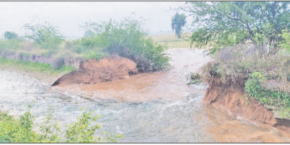
सिरसा। नहर टूटने के बाद खेतों में बहता पानी।

नाथुसरी चौपटा क्षेत्र से गुजरने वाली शरावाली नहर गांव दड़बा कलां के पास रविवार सुबह अचानक टूट गई। नहर में करीब 60 फुट चौड़ी दरार आ गई जिससे किसानों की तैयार खड़ी गेहूं की करीब 50 एकड़ फसल में पानी भर गया, जिससे किसानों की पूरी मेहनत पर पानी फिर गया। किसानों ने सिंचाई विभाग के कर्मचारियों को नहर टूटने की सूचना दी। बताया जाता है कि रविवार सुबह करीब 4 बजे अचानक शरावाली नहर टूट गई।