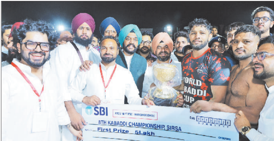
सिरसा। कबड्डी चैंपियनशिप की विजेता टीम को पुरस्कार भेंट करते अतिथि।