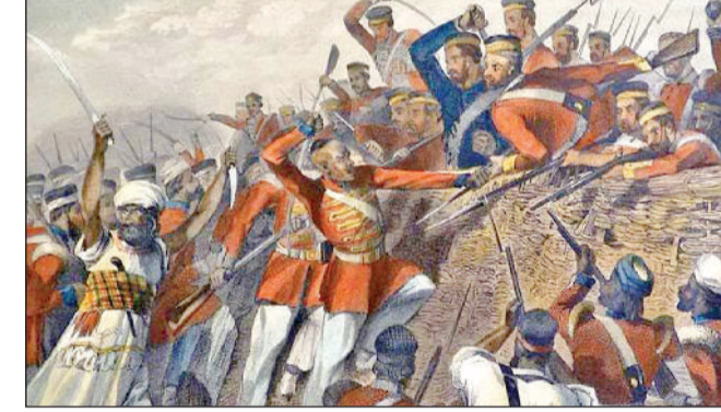
सोनीपत जिले के खरखौदा कस्बे में 15 अगस्त 1857 को हुए भीषण युद्ध के दौरान अंग्रेज सेना से भिड़ते क्रान्तिकारी। (सांकेतिक चित्र)