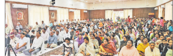
फतेहाबाद। श्रीराम जाप कार्यक्रम में भाग लेते श्रद्धालु।